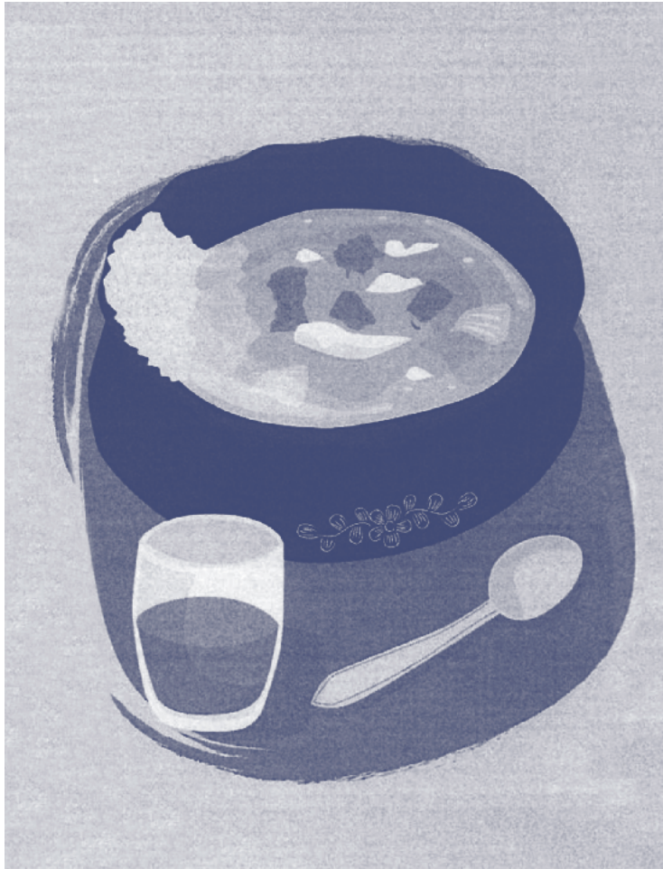
Ilustración de Benjamín Kross Orellana, realizada para el dossier de presentación del menú para el concurso.