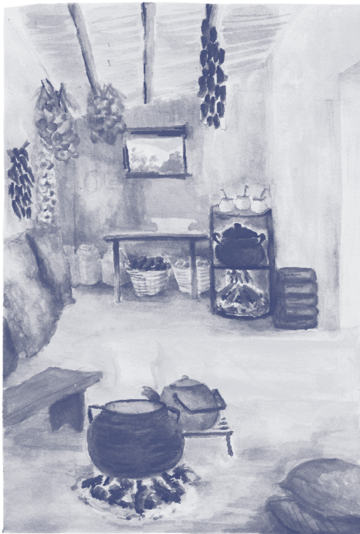
Ilustración de María Cecilia Sius Rivas, realizada para el dossier de presentación del menú para el concurso.