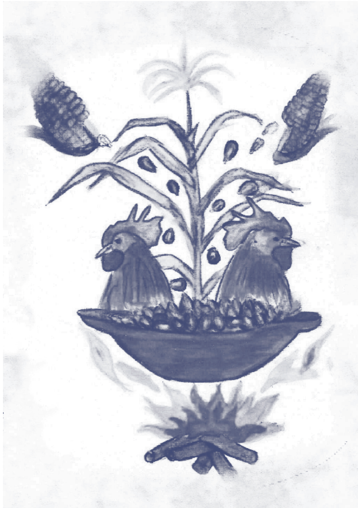
Ilustración de Cristian Cruz, realizada para el dossier de presentación del menú para el concurso.