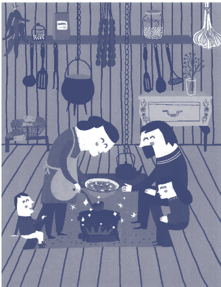
Ilustración de Patricia Aguilera Álvarez, realizada para el dossier de presentación del menú para el concurso.