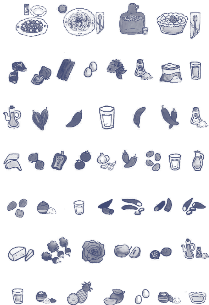
Ilustraciones de Catalina Emilia Candiani Caballero, realizadas para el dossier de presentación del menú para el concurso.